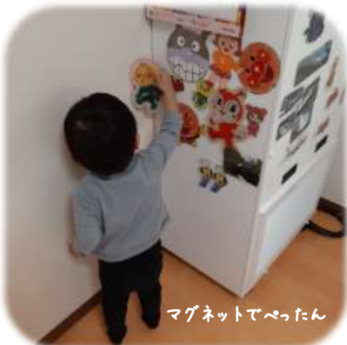
マグネットでべったん

お子様の年齢や体調に合わせて保育や看護を行っておりますので、スケジュールが変わることがあります。